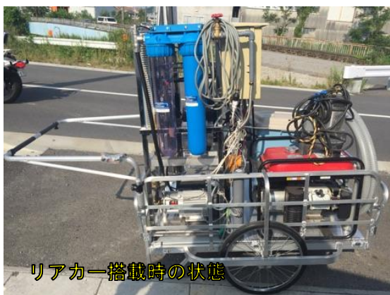
リアカー搭載時の状態

移動式人力造水装置システムは①逆浸透膜 (RO) 消毒剤打ち込み装置内蔵②水汲上ポンプ・ホース③飲料貯水タンク④発電装置⑤折畳み式貯水槽にて飲料水を造水します。逆浸透膜 (RO) 装置には TDS メーターを採用し水中に溶解されている無機物質の総量を測定する機器として水に流れる電流の伝導度 (透明に見える水の中にどれだけの水分子以外の物質が含まれているか) を PPM で示すことができ数値にて確認できます。 リヤカーの荷台に積み込み可能サイズの移動式造水装置システムなので車が進入出来ない場所まで運搬できるので安心です!